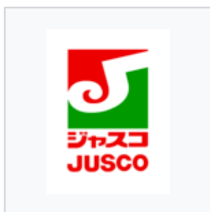
Logo Pertama Jaya Jusco

Mesti ada setengah perasan, Aeon ni dulu, panggilannya adalah Jusco. Pada mula penubuhan Jusco, ada 3 syarikat yang bergabung. Iaitu, Okadaya yang ditubuhkan pada 1758, mula berdagang menjual kain kimono dan aksesori. Futagi, 1937 dan Shiro, 1955. Bergabung menjadi Jusco pada tahun 1969. Dan pada tahun 1980, Jusco pun mula membuka kedai pertamanya atas nama Jusco, dan di Malaysia mula bertapak sejak 1985 lagi.